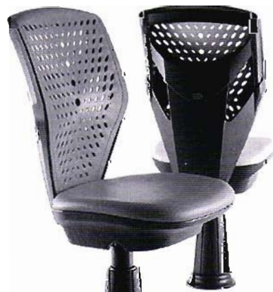
現在ヒット中の同社新素材を採用したバーラーチェア

ですから、相手会社のニーズと言ってもかなり深いところのニーズに対応しているのです。